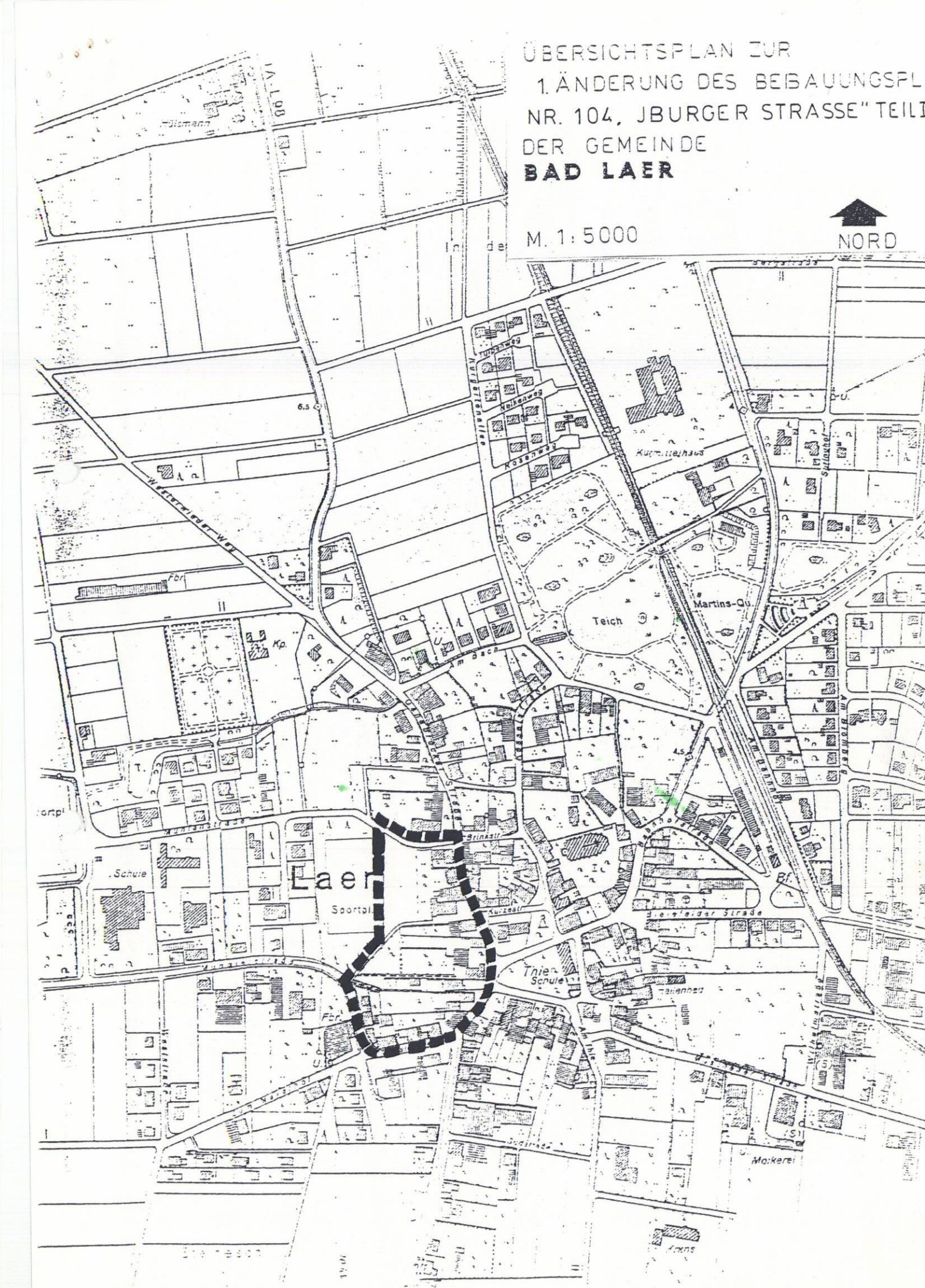
ÜBERSICHTSPLAN ZUR 1. ÄNDERUNG DES BEBAUUNGSPL. NR. 104, 'IBURGER STRASSE' TEIL I DER GEMEINDE BAD LAER